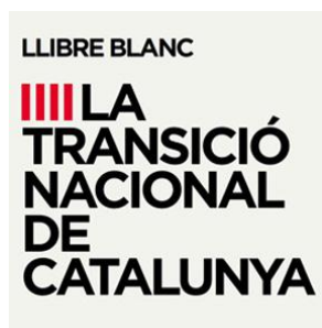
Llibre blanc de la Transició Nacional de Catalunya Setembre 2014

“Fer de Catalunya un país nou on tothom visqui millor, on es garanteixi la cohesió social i el benestar de les persones”