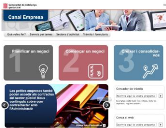
Portal Canal Empresa

“Els països que tinguin administracions menys burocràtiques i més àgils competiran millor”