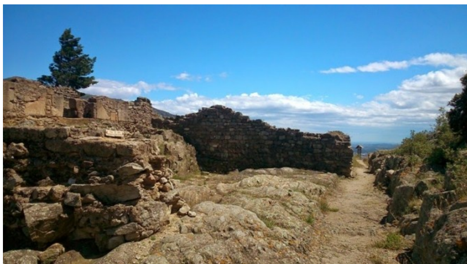
Restes arqueològiques del Coll de Panissars