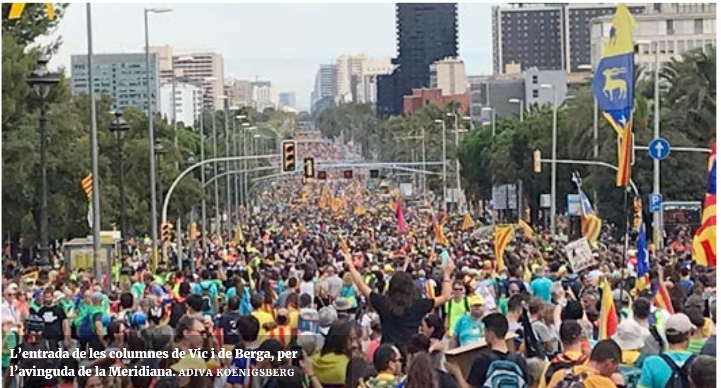
L'entrada de les columnes de Vic i de Berga, per l'avinguda de la Meridiana. ADIVA KOENIGSBERG

La multitudinària mobilització al carrer desborda els partits, reivindica una estratègia més decidida i fa esclatar les contradiccions del govern