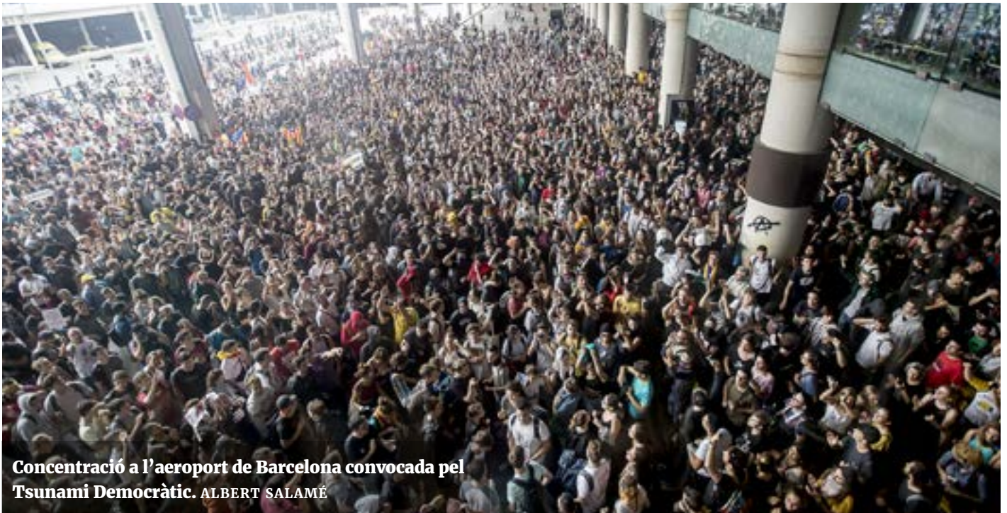
Concentració a l'aeroport de Barcelona convocada pel Tsunami Democràtic.

«Cal fer l'esforç de continuar considerant-los persones a tots, de no treure'ls de sobre el pes d'aquesta responsabilitat»