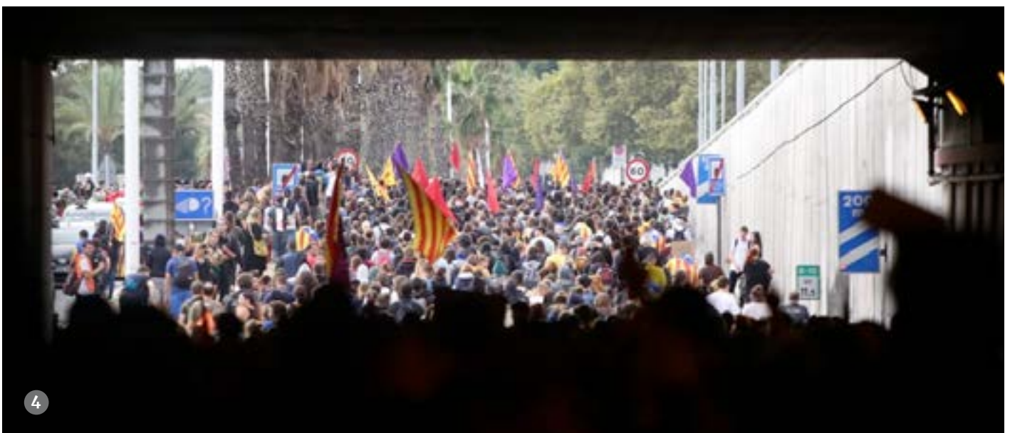
1. Una dona saluda l'entrada de la marxa des del balcó. // 2. Imatge del pas de la columna dels CDR a Castelldefels. // 3. Unes noies porten una pancarta contra l'autoritarisme. // 4. Una part de la Marxa entra per un túnel de circulació a la ciutat de Barcelona.