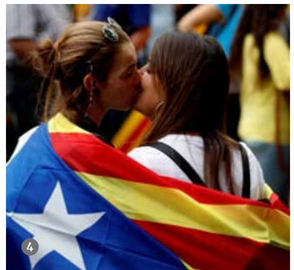
Milers de persones omplen el passeig de Gràcia de Barcelona en la manifestació unitària de la vaga general.