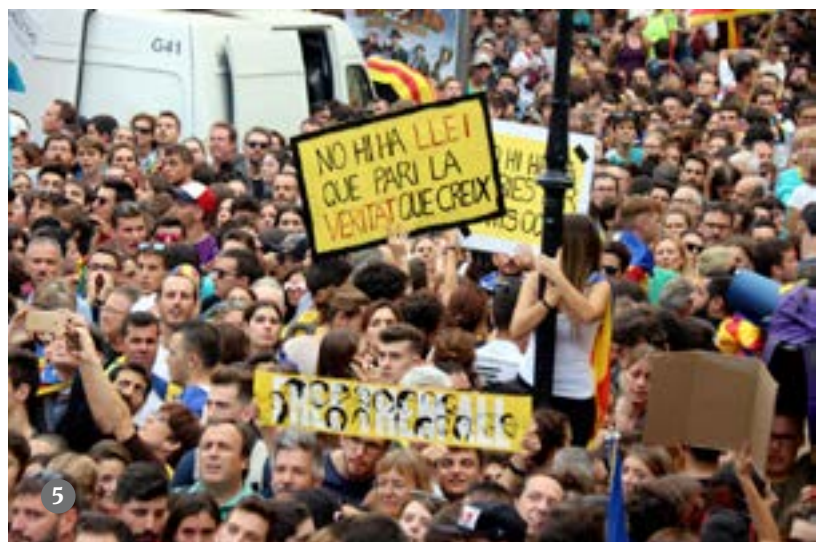
1. Una pancarta reclama 'Codis QR', en relació amb l'app del Tsunami Democràtic, enmig de la Marxa per la Llibertat a Badalona. ACN // 2. Un grup de motociclistes ha precedit l'entrada de la Marxa per la Llibertat per la Gran Via de Barcelona. ACN // 3, 4 i 5. Milers de persones omplen el passeig de Gràcia de Barcelona en la manifestació unitària de la vaga general. ACN