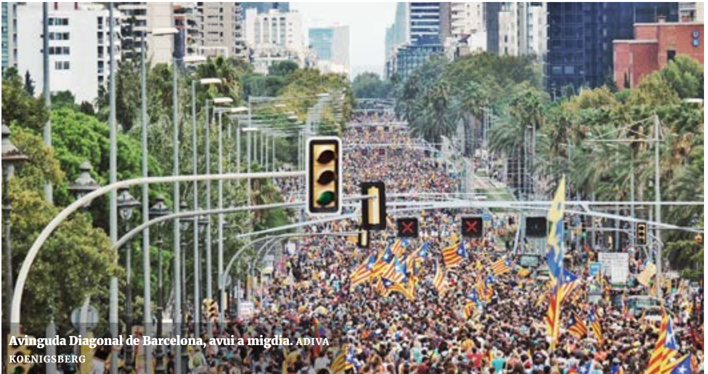
Avinguda Diagonal de Barcelona, avui a migdia. ADIVA KOENIGSBERG