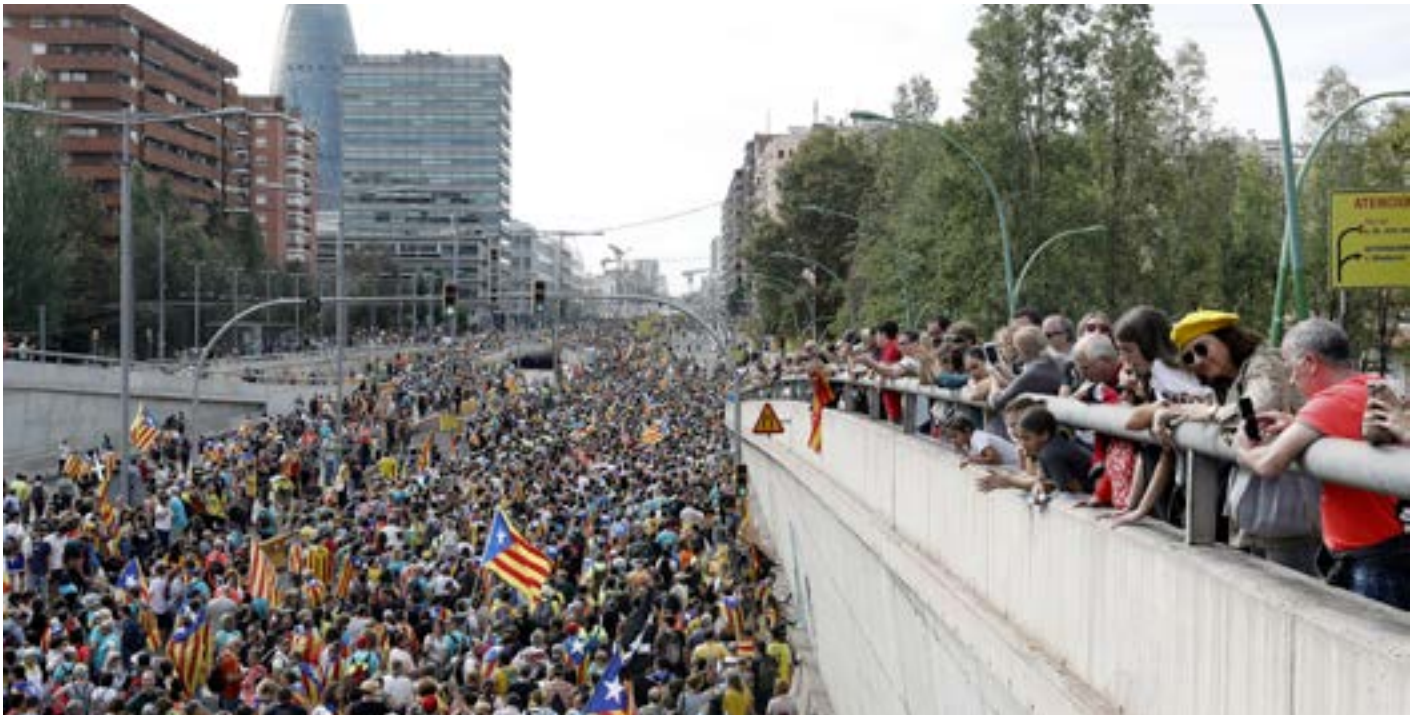
La columna de Girona ha entrat a Barcelona per la Gran Via.

transversalitat política i social pròpia del moviment i que no es veia des del 3-O. L'independentisme eixampla la base quan manté la confrontació oberta amb l'estat, no pas quan es doblega al marc autonòmic. La vaga ha obligat a tancar la Seat, ha rebut el suport dels estibadors del port de Barcelona i les marxades han demostrat la diversitat d'un moviment que és interclassista, desmentint qual-sevol lectura que l'intenti estigmatitzar. L'únic supremacisme que hi ha a Catalunya és l'espanyolisme, que s'expressa a través de l'extrema dreta.