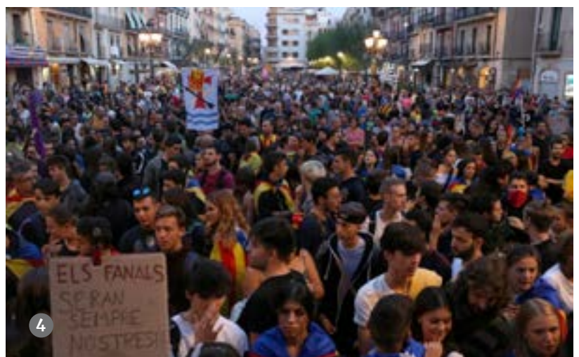
1. Concentració multitudinària a València contra la repressió al Principat. vw // 2. Milers de persones s'han manifestat a Lleida. EFE // 3. Milers de persones s'han concentrat davant dels jutjats de Girona. ACN // 4. Milers de persones s'han concentrat a la plaça Imperial Tarraco de Tarragona en rebuig a la sentència. ACN