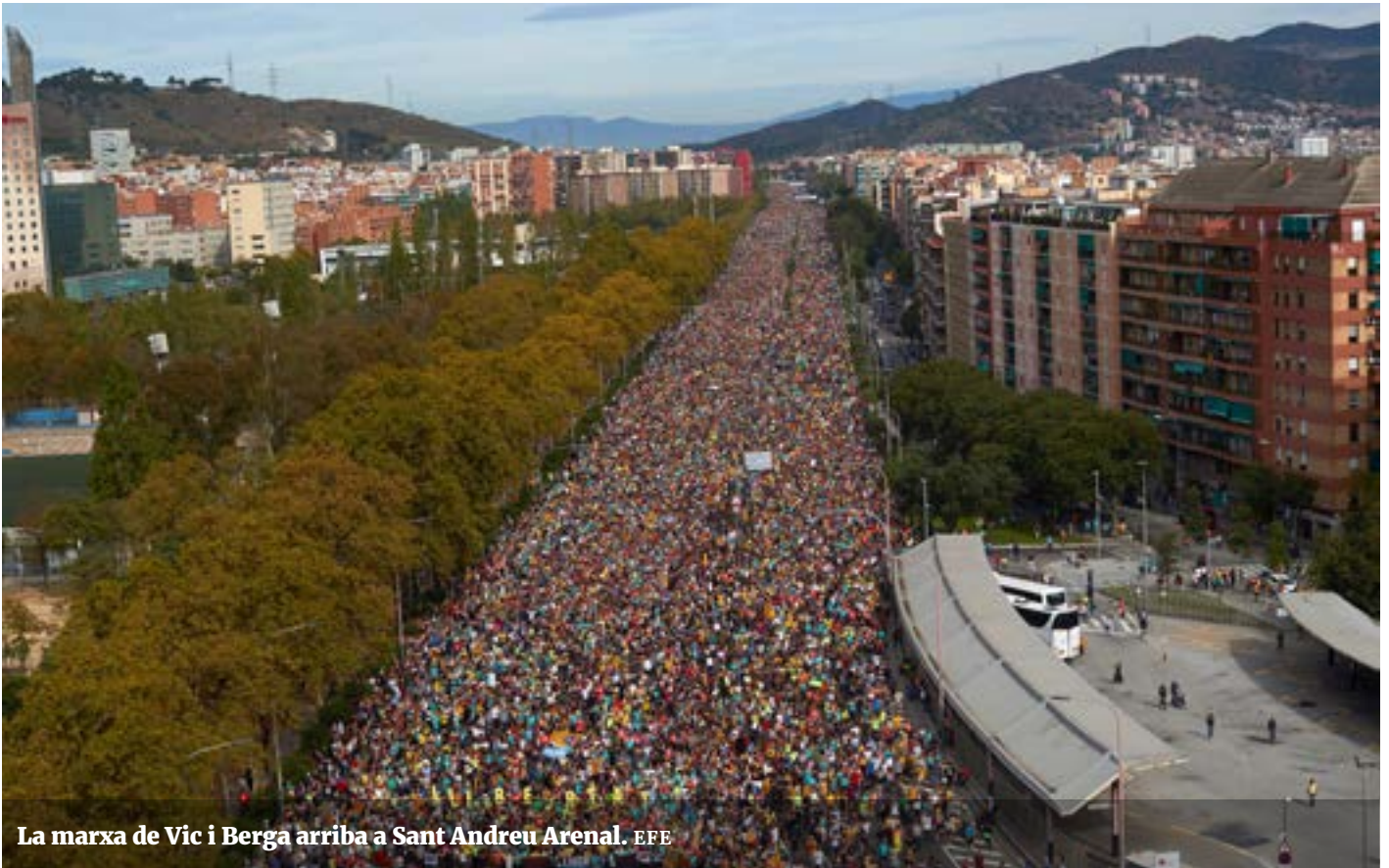
La marxa de Vic i Berga arriba a Sant Andreu Arenal.

la marxa continua avançant. Fins que passa una hora. Una hora seguida de gent desfilitant, i aquesta és tan sols una de les marxes que han de confluïr avui a Barcelona. Fa tanta impressió que els veïns espanyolistes també s'exclamen i s'exciten.