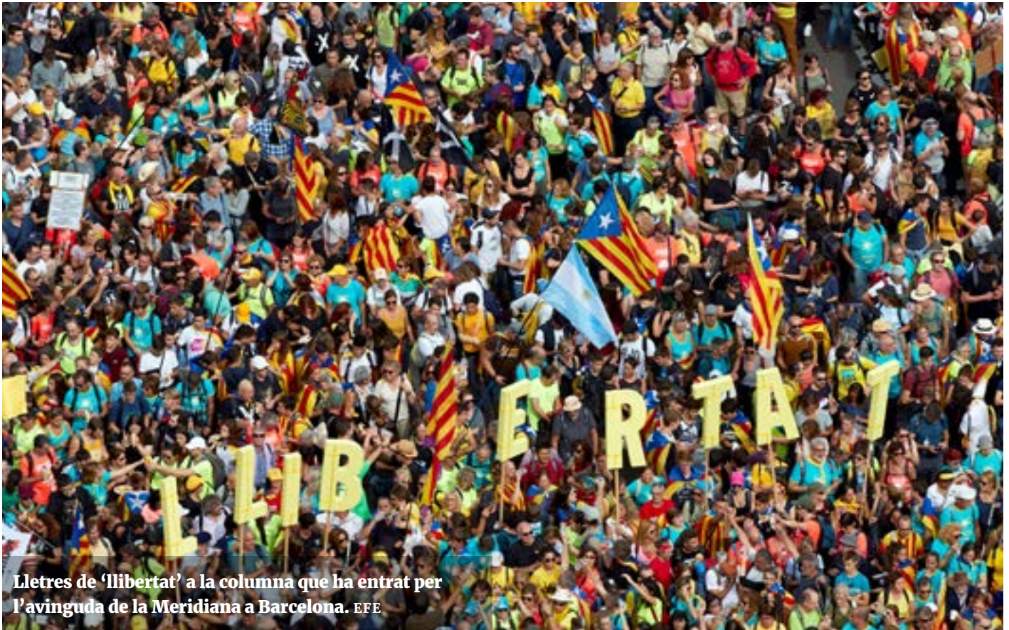
Lletres de 'llibertat' a la columna que ha entrat per l'avinguda de la Meridiana a Barcelona.

corona el pont per penjar-hi una pancarta: 'Benvingudes a Nou Barris. República catalana.' Al fons de l'autopista, ja s'intueixen els vehicles de la policia, i pocs minuts després arriba un estol de motos tocant el clàxon. Si tanquessin els ulls, pensàriem en el soroll d'un embús monumental, però no: són els motoristes que ho donen tot per saludar els congregats, que de seguida aplaudeixen, xiulen, criden, branden algunes estelades. 'Visca Catalunya lliure!', fan, una vegada i una altra, emocionats. I unes quantes botzines s'imposen al ritme de 'Els carrers seran sempre nostres'. I quan ja s'albira la pancarta de la capçalera i el formigueig de la multitud que s'acosta, els del pont comencen a cantar 'Els segadors'.