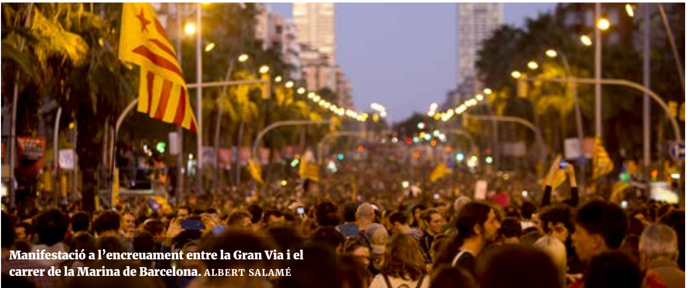
Manifestació a l'encreuament entre la Gran Via i el carrer de la Marina de Barcelona. ALBERT SALAMÉ

«Ara continueu sortint públicament a criminalitzar el poble organitzat que posa el cos per avançar cap a una democràcia més plena i que es protegeix amb barricades per no perdre els ulls o els testicles»