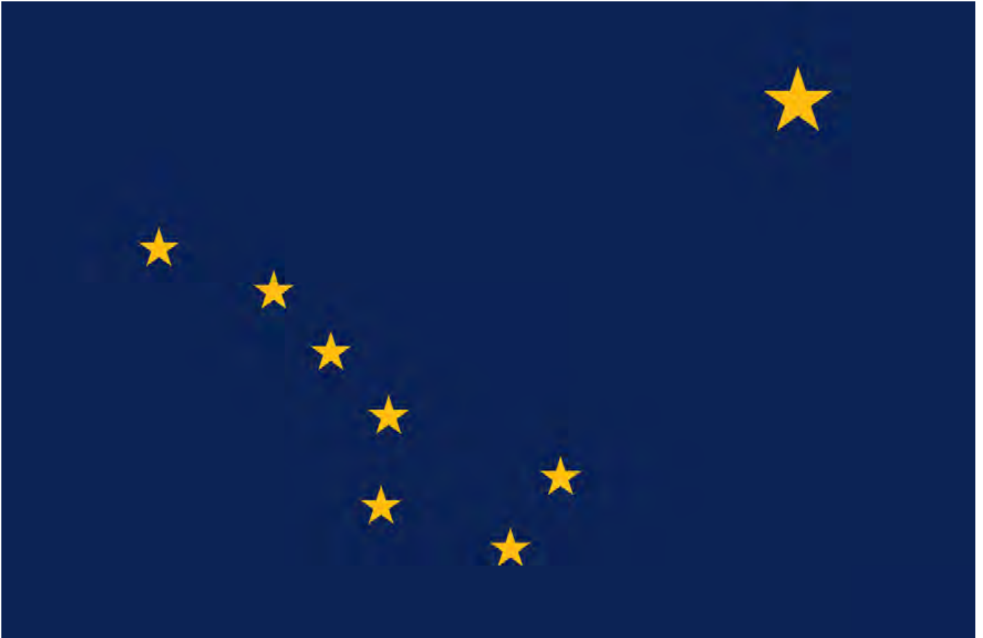
Bandera d'Alaska.