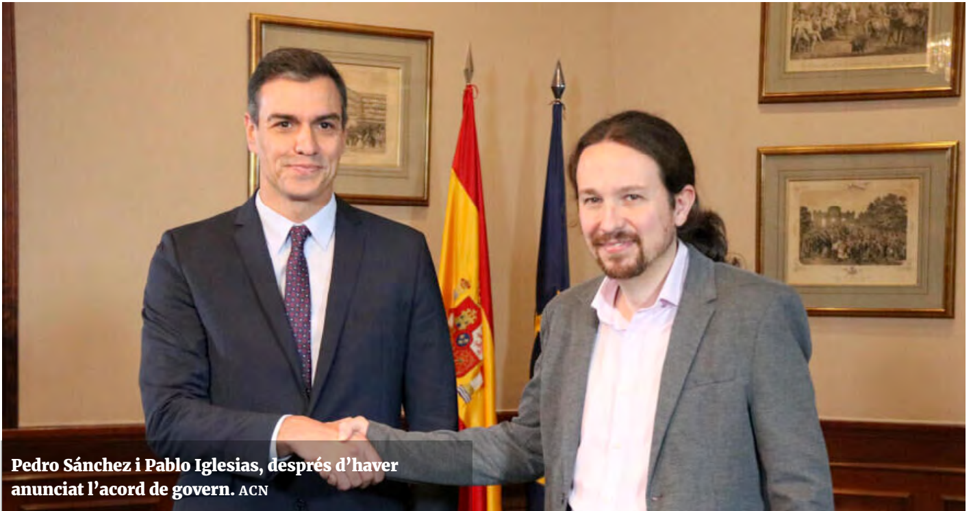
Pedro Sánchez i Pablo Iglesias, després d'haver anunciat l'acord de govern.