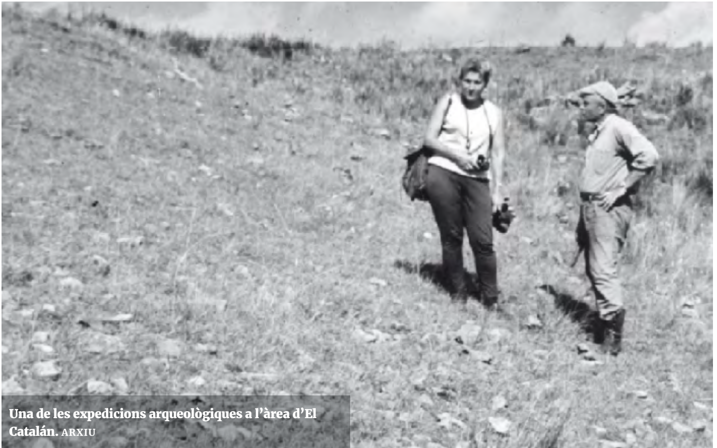
Una de les expedicions arqueològiques a l'àrea d'El Catalán.

Una època, val a dir, en què ja recorria l'actual província d'Artigas un capità anomenat precisament Carlos Catalá . Aquest fill del pedagog valencià Josep Català i Codina va rebre l'encàrrec oficial d'establir pobles als límits amb el Brasil per a assegurar la sobirania nacional a la frontera nord. A més dels municipis de Constitució i Cuareim, el 12 de setembre de 1852 va fundar San Eugenio del Cuareim, l'actual ciutat d' Artigas , capital del departament homònim i que l'homenatja amb un carrer i una plaça .