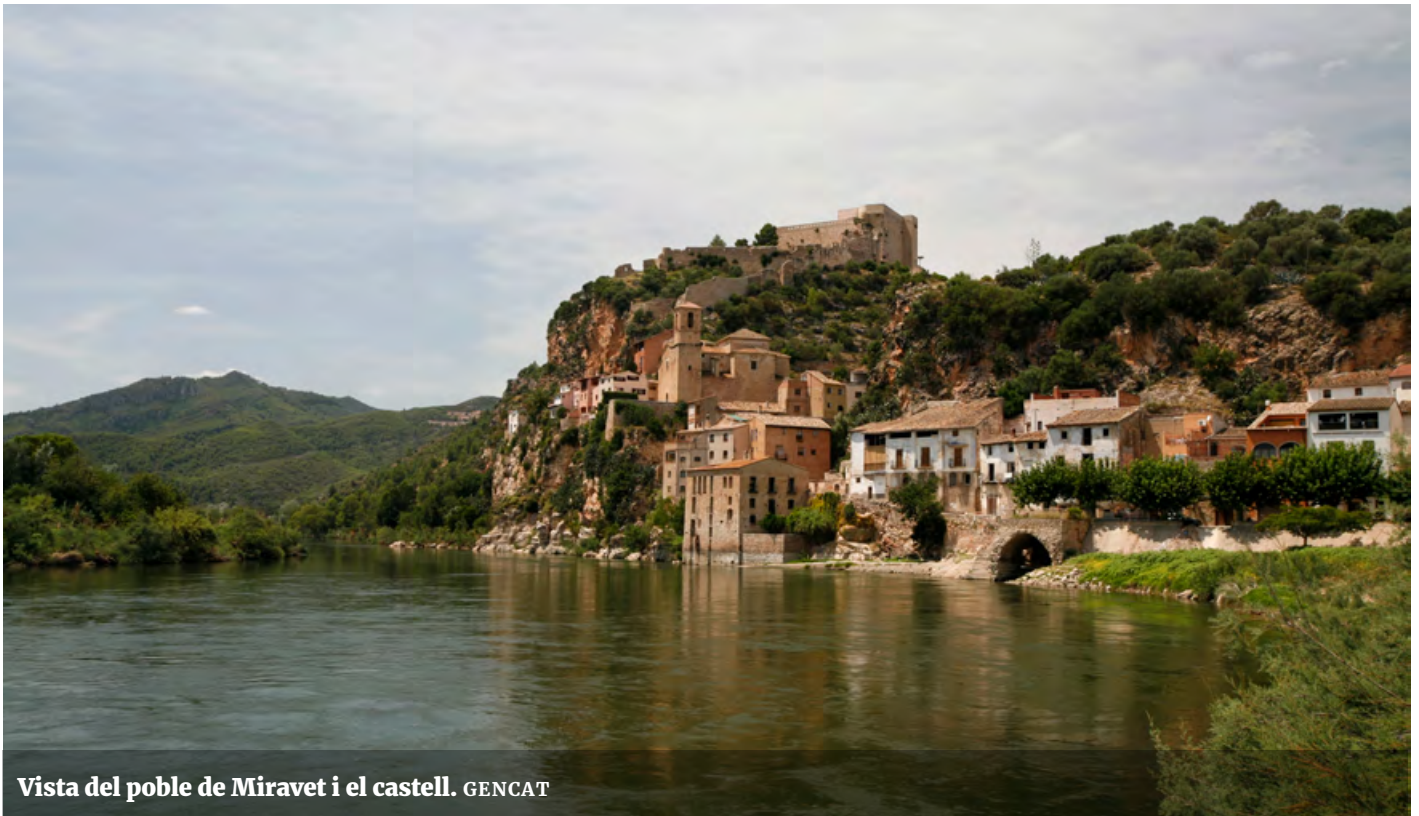
Vista del poble de Miravet i el castell.