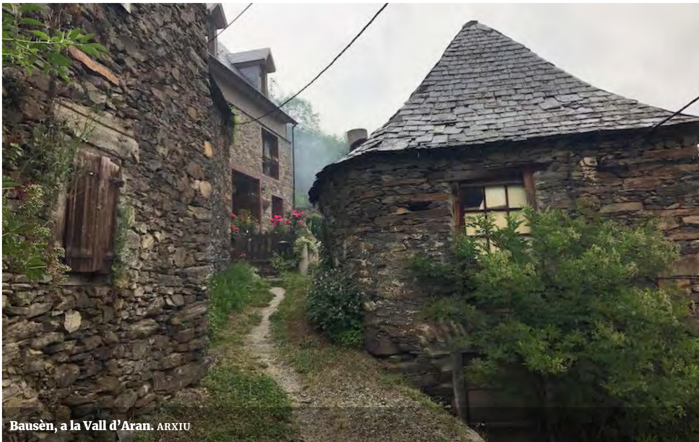
Bausen, a la Vall d'Aran.

viatge hem après moltes coses i una d'elles és que no heu de fer cas dels fulletons publicitaris o les guies turístiques, dels llibres de viatges o de les enciclopèdies, ni de les imatges que surten a internet. Ni tampoc del que us expliquem en aquest llibre. És tot molt diferent quan t'hi trobes i hem tingut la grata experiència que, en tots i cadascun dels pobles que hem visitat, la realitat és millor.'