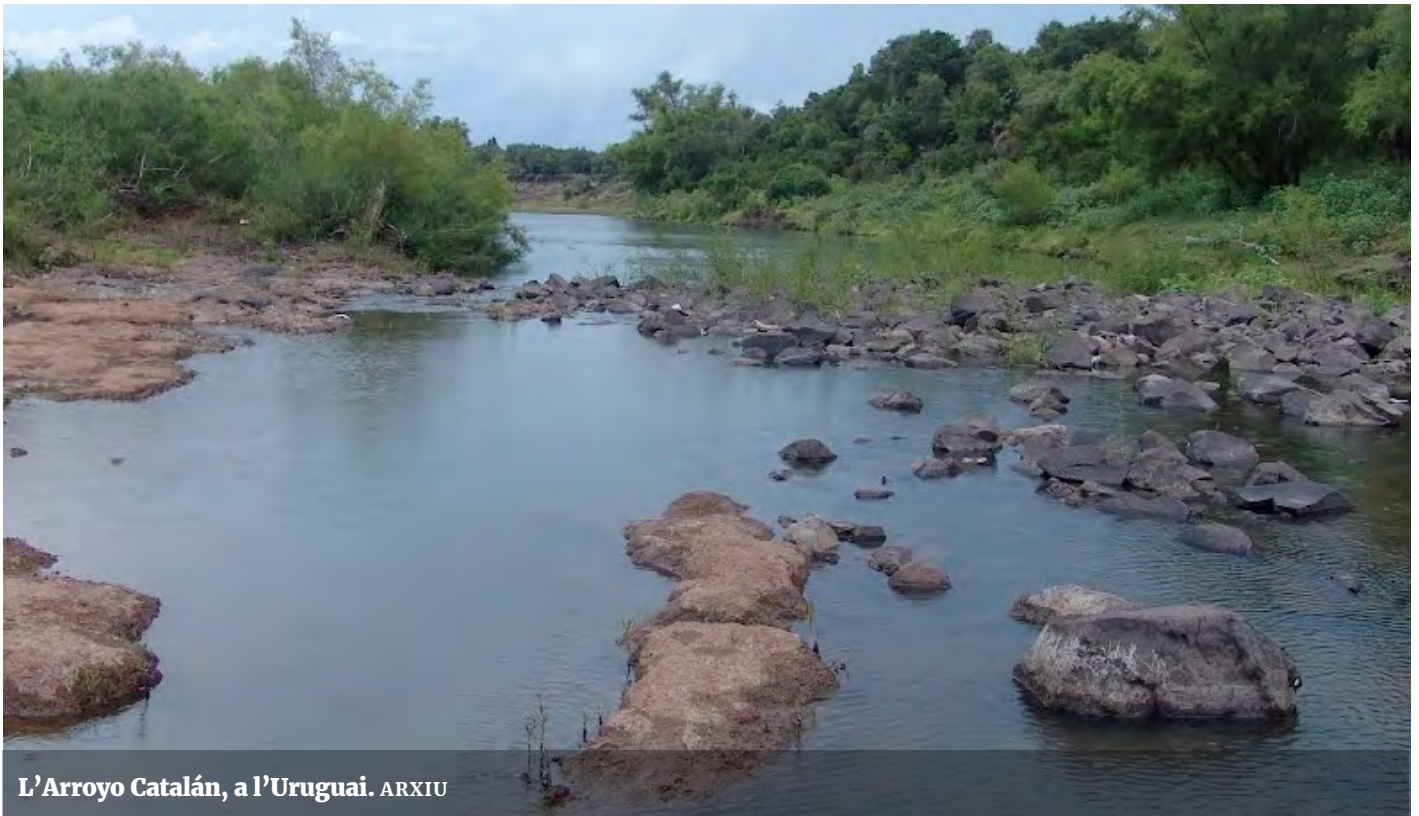
L'Arroyo Catalán, a l'Uruguai.