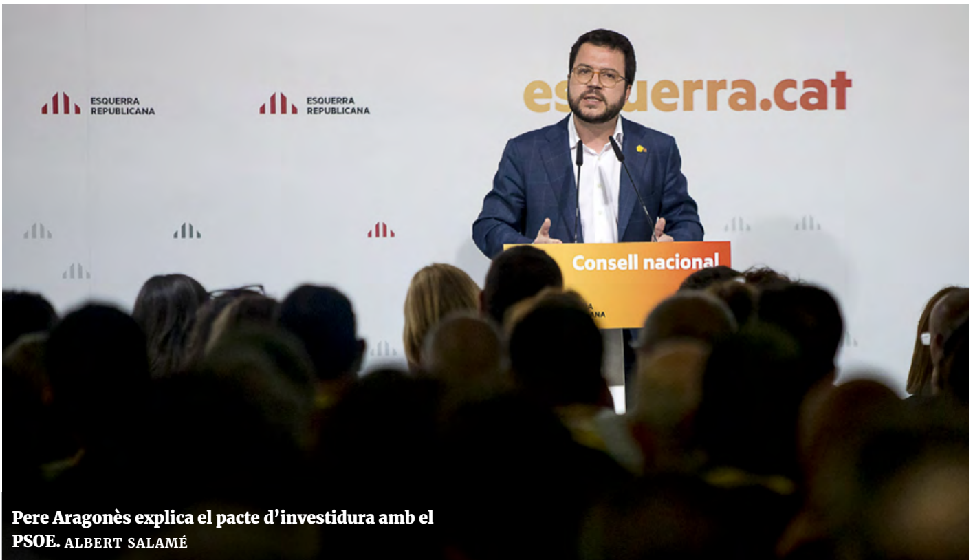
Pere Aragonès explica el pacte d'investidura amb el PSOE.

setmana de vigília de Reis, malgrat que no va tenir cap problema a forçar la repetició de les eleccions espanyoles el 10 de novembre pensant que obtindria un resultat millor que el 28 d'abril. Sánchez va convocar les eleccions després d'haver trencat la via de diàleg oberta amb la Generalitat i la Declaració de Pedralbes, pressionat per la manifestació de l'extrema dreta espanyola a Madrid, i quan ERC i JxCat havien tombat el pressupost al congrés espanyol.