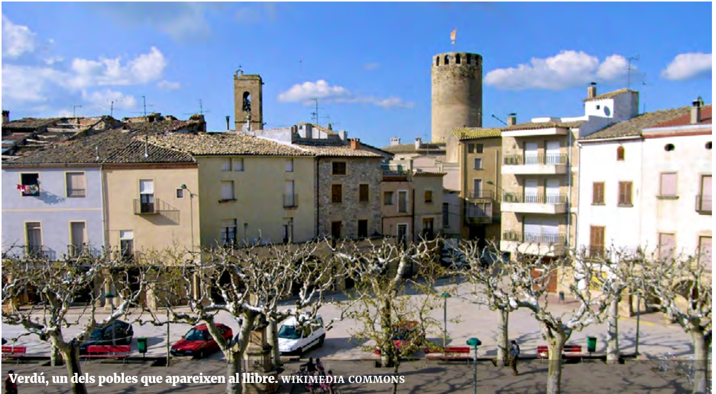
Verdú, un dels pobles que apareixen al llibre.

caràcter, amb texts de Carles Cartaïa i fotografies de Jordi Longás.