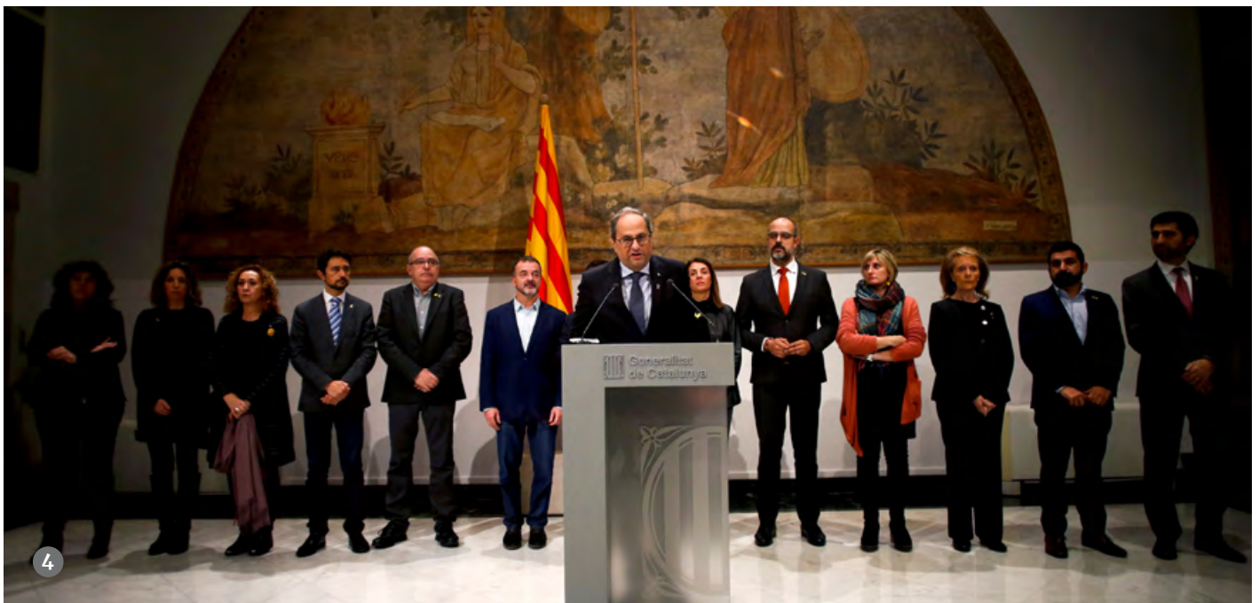
1, 2 i 3. El consell executiu s'ha reunit de manera extraordinària per valorar la resolució de la JEC. EFE // 4. Compareixença del president Torra i els consellers posterior a la reunió del consell executiu. EFE