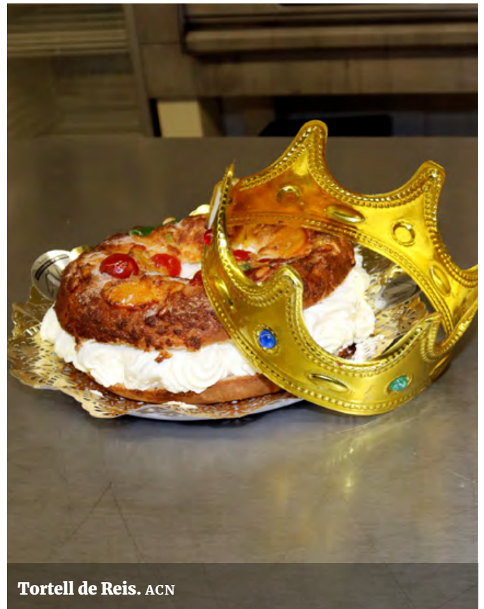
Tortell de Reis. ACN

El cilindre, abans de fer rotlle, s'allarga una mica amb les mans i després s'ajunten els dos caps. El que no té el massapà s'aixafa i l'altre es col·loca a sobre i s'ajunta.