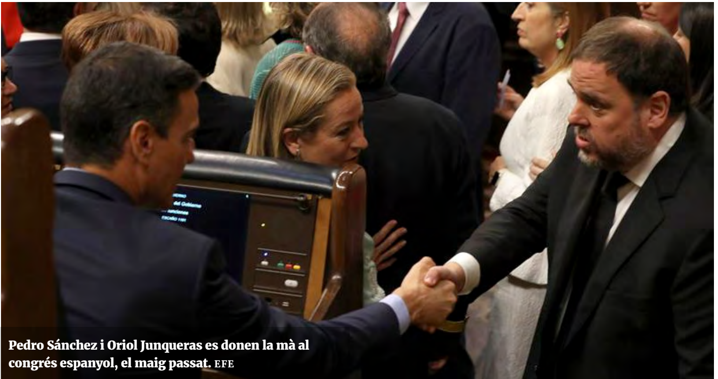
Pedro Sánchez i Oriol Junqueras es donen la mà al congrés espanyol, el maig passat.