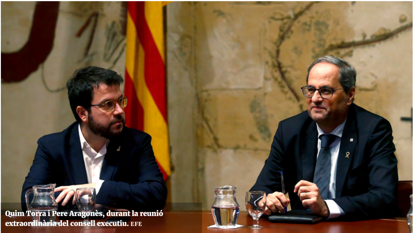
Quim Torra i Pere Aragonès, durant la reunió extraordinària del consell executiu.

La decisió de la Junta Electoral espanyola contra Torra i Junqueras dinamita qualsevol possibilitat de diàleg i posa en qüestió la investidura del dirigent del PSOE *** Puig demana al govern espanyol i a la UE un pacte per a salvar l'Albufera *** Més per Mallorca preveu que ERC defensi els interessos de les Illes en una 'segona fase'