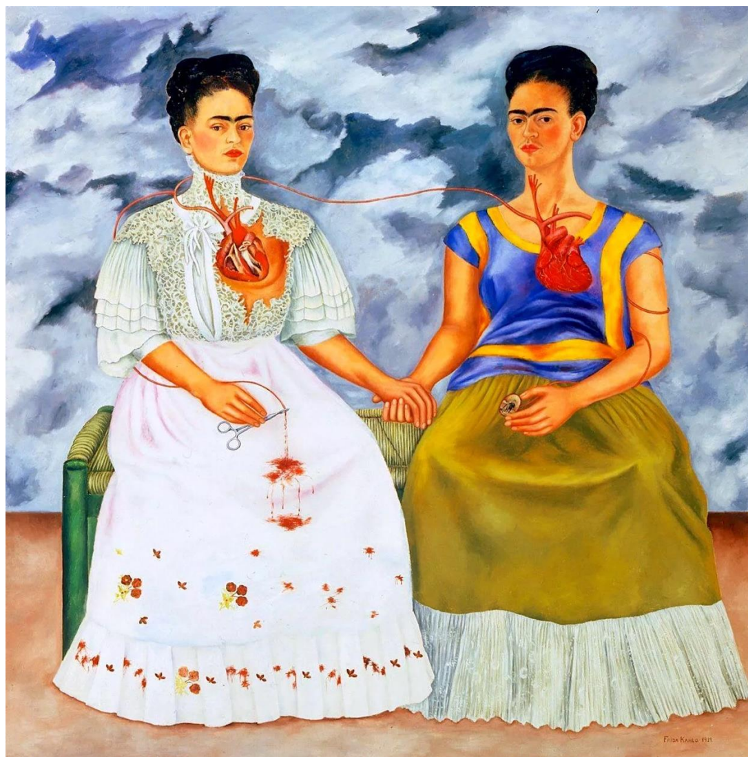
Frida Kahlo, Las dos Fridas , 1939. Oli sobre tela, 173,5 x 173 cm. Museo de Arte Moderno de México, México DF.

Análisis y comentario de una obra, con los siguientes apartados: contexto y estilo/movimiento al que pertenece la obra y características de dicha obra en relación con este estilo; autor, obra y estilo personal; análisis descriptivo formal y técnica: composición, color, espacio, luz, texturas, formas, aspectos técnicos, líneas...; análisis iconográfico e iconológico: significado de la obra y repercusión en su momento; y antecedentes e influencias posteriores.