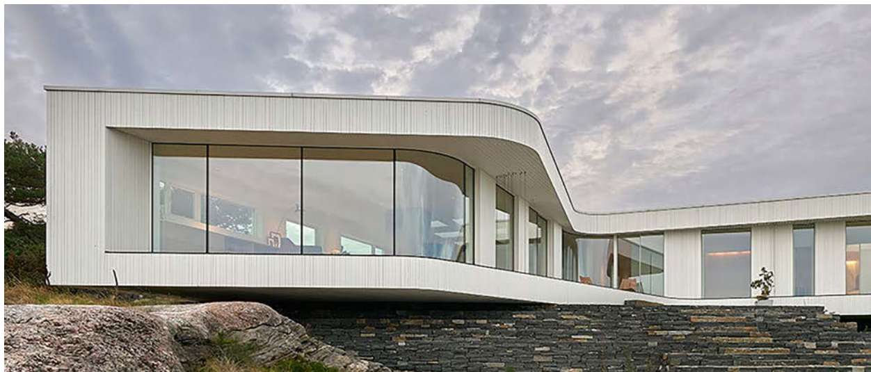
IMATGE D. Villa AT. Arquitecte: Todd Saunders, guanyador en la Categoria Arquitectura, Edificació i Disseny d'Estructures del Platinum A' Design Award (2018)

La Villa AT està ubicada en un punt elevat del terreny, amb una planta en forma de L que gira al voltant d'una llarga façana de vidre corbada i que ofereix unes vistes cinematogràfiques del paisatge. L'edificació contrasta amb les formes convencionals mitjançant una façana que es corba suaument i que utilitza els llistons de fusta d'una manera fluida i contemporània. De lluny, la Villa AT té una aparença serena i minimalista, però de prop la textura rugosa dels seus llistons de fusta es fa evident.