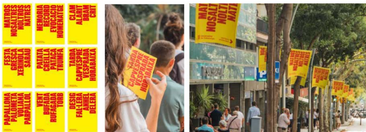
IMATGE B. Cartell guanyador del concurs i diferents elements de la mateixa imatge gràfica i aplicacions

Segons l'estudi guanyador del concurs: «El cartell posa la llengua catalana amb les seves variants dialectals com a protagonista. Les paraules dibuixen la senyera descrivint els colors de les barres amb sinònims que demostren la riquesa de la llengua».