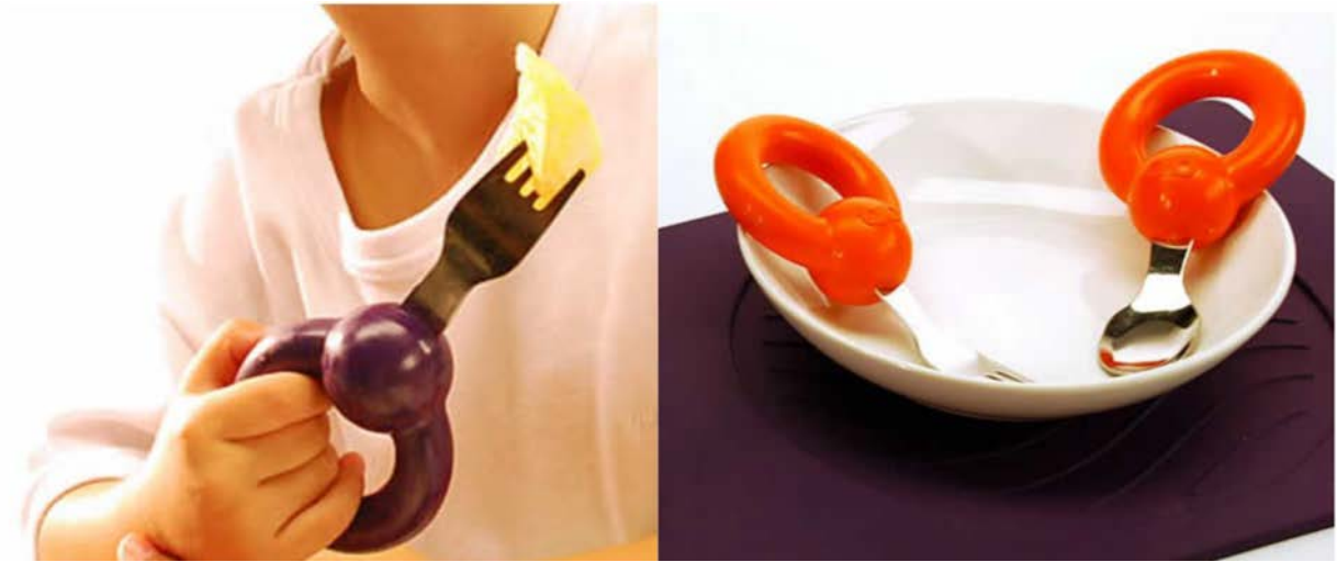
IMATGE C. Projecte de coberts anella. Universoandamio

Llegiu aquest fragment d'un article del web ForoAlfa :